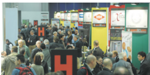
Forum Agenti è la Fiera dei Colloqui di Ricerca Agenti di Commercio

A pre domani Forum Agenti, la fiera dedicata agli Agenti di Commercio, Rappresentanti e Venditori. La dodicesima edizione della Manifestazione si svolge a Milano, presso Fiera Milano Rho (Ingresso Viale Porta Est - Padiglione 8), e sarà visibile fino alle ore 14 di sabato 25 novembre 2017. Le oltre 200 aziende partecipanti alla manifestazione come espositori selezioneranno direttamente nei tre giorni della manifestazione i loro nuovi Agenti di Commercio, rendendo il Forum un importante momento in cui le opportunità di lavoro nel campo della rappresentanza commerciale si moltiplicano. Se il focus della manifestazione sono senza ombra di dubbio i Colloqui di Ricerca Agenti di Commercio, Forum Agenti, con il suo intenso programma di corsi di formazione, seminari e workshop, rappresenta anche un importante momento di formazione e aggiornamento per tutta la categoria. Nei tre spazi destinati ai convegni, il Teatro Mostra Museo della Vendita, il Teatro Soluzione Agenti e il Teatro Enasarco, nei tre giorni della manifestazione si susseguiranno 59 interventi. A tenere i corsi gratuiti di formazione pensati ad hoc