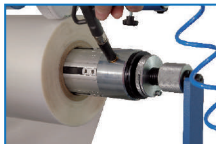
Albero porta bobina pneumatico

Laminatrice con alimentazione ad alta pila e strappo automatici. Formato minimo mm 200x300 massimo mm 530x750. Kit XL per formato massimo mm. 530x1000 (con pallet stacker solo fino a 750 mm). Cilindro di laminazione in metallo cromato. 2 Cilindri speciali di contropressione anti-adesivi, optional. Necessita di aria compressa, 150 l/m 6 Bar. Capacità di carica alimentatore 540 mm. Grammatura laminabile da 115 a 600 g/mq. Velocità regolabile da 0 a 35 mt/m. sia fronte che fronte/retro. Pareggiatore. Foiler per film metallizzato e laminatura spot con toner. Albero supplementare portabobina. Pallet stacker integrato da mm 700 con 1 pallet. Paranchino porta bobina elettrico. Assorbimento 7000 W.