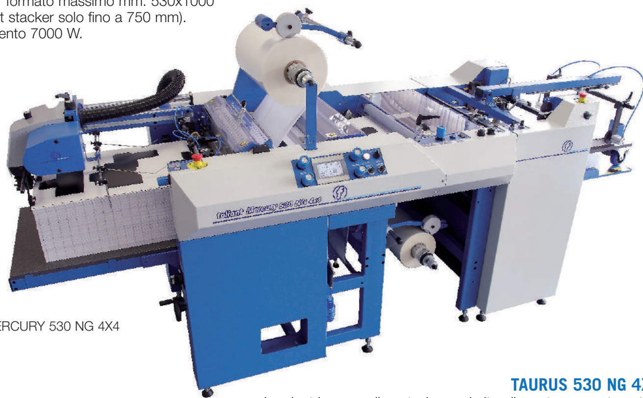
MERCURY 530 NG 4X4

MERCURY 530 NG 4X4 Stesse caratteristiche tranne: Formato minimo mm 200x300 massimo mm 530x750. Kit XL per formato massimo mm. 530x1000 (con pallet stacker solo fino a 750 mm). Assorbimento 7000 W.